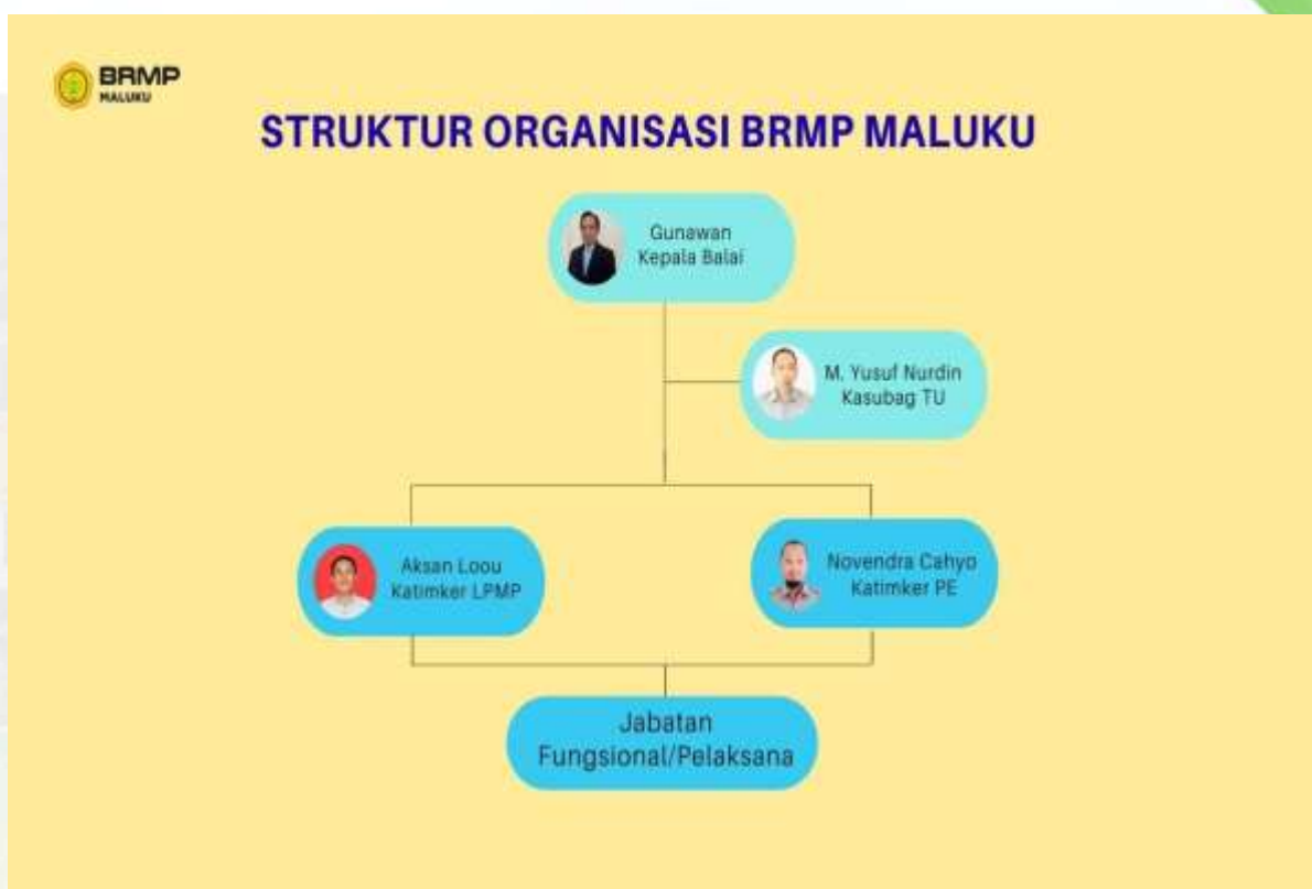
Lampiran 1. Struktur Organisasi Balai Penerapan Modernisasi Pertanian (BRMP)