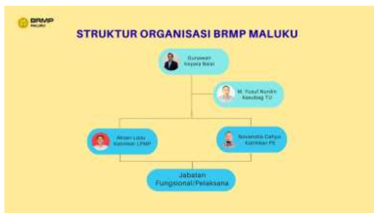
Gambar 1. Struktur Organisasi BRMP

BRMP lahir dari transformasi Badan Standardisasi Instrumen Pertanian melalui Peraturan Presiden Nomor 192 Tahun 2024 tentang Kementerian Pertanian yang memiliki tugas menyelenggarakan perakitan dan modernisasi pertanian. Berdasarkan Permentan Nomor 02 Tahun 2025 tentang Organisasi dan Tata Kerja Kementerian Pertanian, BRMP terdiri dari Sekretariat Badan dan 4 Pusat Perakitan dan Modernisasi. Organisasi Unit Pelaksana Teknis BRMP diatur dalam Permentan Nomor 10 Tahun 2025 tentang Organisasi dan Tata Kerja Unit Pelaksana Teknis Lingkup Badan Perakitan dan Modernisasi Pertanian, yang terdiri dari 7 Balai Besar Perakitan dan Modernisasi, 15 Balai Perakitan dan Pengujian, 33 Balai Penerapan Modernisasi Pertanian, 1 Balai Pengelola Hasil Perakitan dan Modernisasi Pertanian, dan 2 Loka Perakitan dan Pengujian.